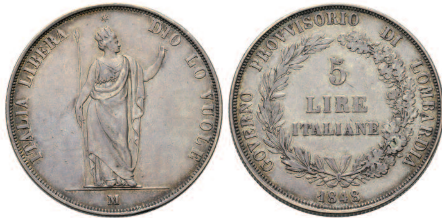
Uno scudo da 5 lire milanesi del 1848 (misura reale mm 37), moneta dal forte messaggio propagandistico trasformata in scatoletta porta dispacci (argento, mm 37, g 25).

In occasione delle Cinque Giornate del 1848, il Governo provvisorio di Lombardia fece coniare, fra le altre, monete da 5 lire in argento al motto di «Italia libera Dio lo vuole». Ebbene, alcuni di questi 'scudi' vennero trasformati dai patrioti lombardi in contenitori per trasportare in modo discreto messaggi segreti e dispacci mentre, chiusa l'effimera parentesi di libertà, furono i sostenitori dell'Austria a riutilizzare le medesime monete collocandovi dentro ritratti in miniatura del feldmaresciallo Radetzky con slogan tipo «Dio lo vuole ma Radetzky no».