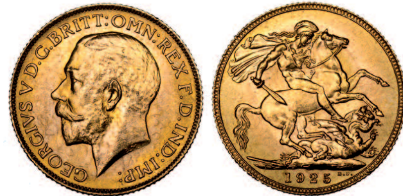
Sterline (sovrana, misura reale mm 22) in oro datata 1925 ma coniata nel 1991 per i piloti della Raf e i membri delle Forze speciali britanniche impiegati in Iraq e Kuwait (oro mm 22,05, g 7,99). In basso, due monete del Regno Lombardo Veneto ((misure reali, mm 24 quelle in alto, mm 30 in basso) trasformate in oggetti di propaganda filopapale e asburgica, con all'interno i ritratti di Pio IX e Radetzky (rame, mm 24,0 e 30,5, g 8,75 e 17,50).

tessero impiegarle in caso di bisogno per approvvigionarsi di cibo o medicine, armi e abiti, trovare riparo e nascondiglio presso la popolazione civile, corrompere possibili collaborazionisti e pagare informatori. Una consuetudine durata a lungo ed estesa in molti paesi anche agli equipaggi dei velivoli militari destinati a compiere azioni su territori ostili. Durante la guerra del Golfo nel 1991, le Forze armate britanniche – in special modo i piloti della Royal Air Force e i soldati dello Special Air Service – si videro consegnare un fornito kit di sopravvivenza nel quale erano contenute anche 20 sterline in oro. Monete speciali, prodotte dalla Royal Mint, la zecca di sua maestà, usando conii con il ritratto di re Giorgio V e la data 1925, e riconoscibili da quelle originali per il bordo più spesso.