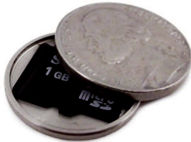
Versione moderna del famoso nichelino cavo da 5 centesimi di dollaro, capace di ospitare all'interno una scheda micro Sd.

Dal Secondo conflitto mondiale al Golfo, dalle Cinque Giornate di Milano alla Guerra fredda, ecco le monete che hanno fatto parte – come riserve di valore, ma anche come contenitori per messaggi segreti, segni di riconoscimento o vere e proprie armi – del 'corredo' di patrioti e agenti segreti.