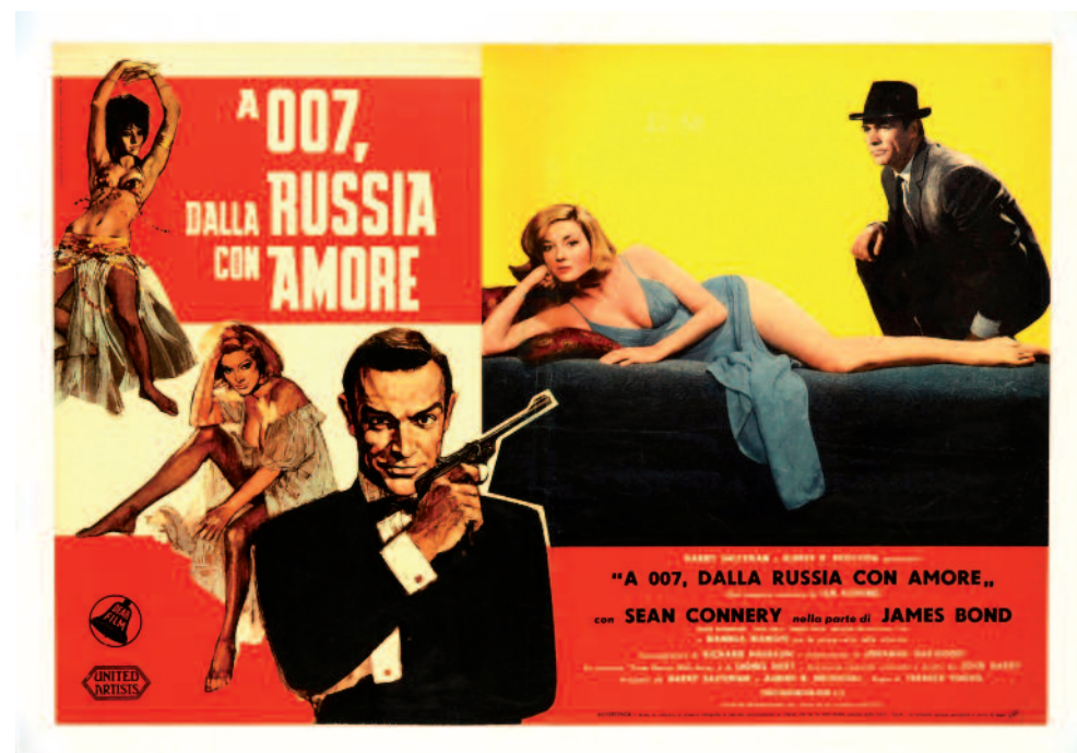
Manifesto del film Dalla Russia con amore (1963) in cui l'agente 007 porta, nella sua valigetta, anche 50 sovrane in oro «per ogni evenienza».

più sofisticati gadget – una valigetta con armi, munizioni, altri dispositivi speciali e due nastri, occultati nelle pareti, contenenti ciascuno 25 sovrane d'oro. Verso la fine della pellicola, 007 rivela l'esistenza di quelle monete a uno dei sicari della Spectre il quale, tentando di impadronirsene, rimane ucciso dall'esplosione della valigetta. Quando si dice la cupidigia... Come altri dettagli presenti nei film tratti dai romanzi di Ian Fleming, anche quello delle sovrane d'oro ha un riscontro reale nella storia delle operazioni d'intelligence. Già nel corso della Seconda guerra mondiale, agli agenti britannici del Special Operations Executive (Soe) destinati a compiere sabotaggi dietro le linee tedesche venivano fornite monete in oro – non solo sterline, ma anche di altri tipi in uso nei paesi occupati – perché po-