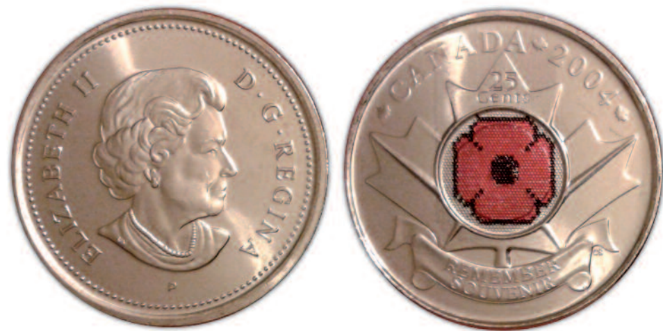
Esemplare della presunta 'moneta-spia' canadese del 2004 ((misura reale mm 24). Secondo alcuni, avrebbe contenuto dispositivi di tracking ad alta tecnologia.

Dal Secondo conflitto mondiale al Golfo, dalle Cinque Giornate di Milano alla Guerra fredda, ecco le monete che hanno fatto parte – come riserve di valore, ma anche come contenitori per messaggi segreti, segni di riconoscimento o vere e proprie armi – del 'corredo' di patrioti e agenti segreti.